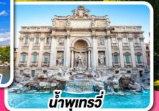
น้ำพุกรวี