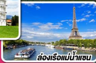
ล่องเรือแม่น้ำแซน