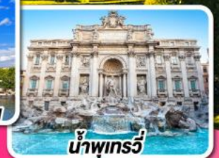
น้ำพุเกรวี