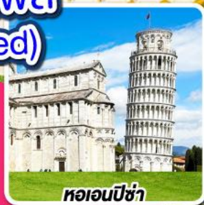
หออนปิซ่า