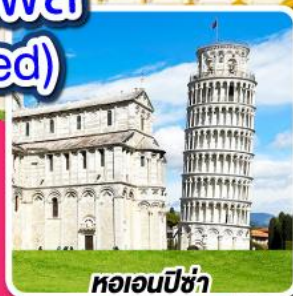
หออนปิซ่า