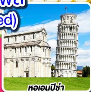
หอเอนปิซ่า