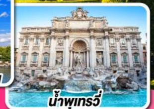
น้ำพุกรวี